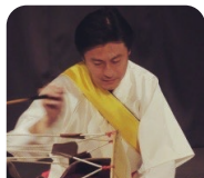
韓国伝統打楽器奏者 李昌燮(イ・チャンソブ)